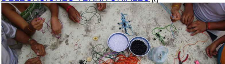
DELEGACIONES TERRITORIALES [2]