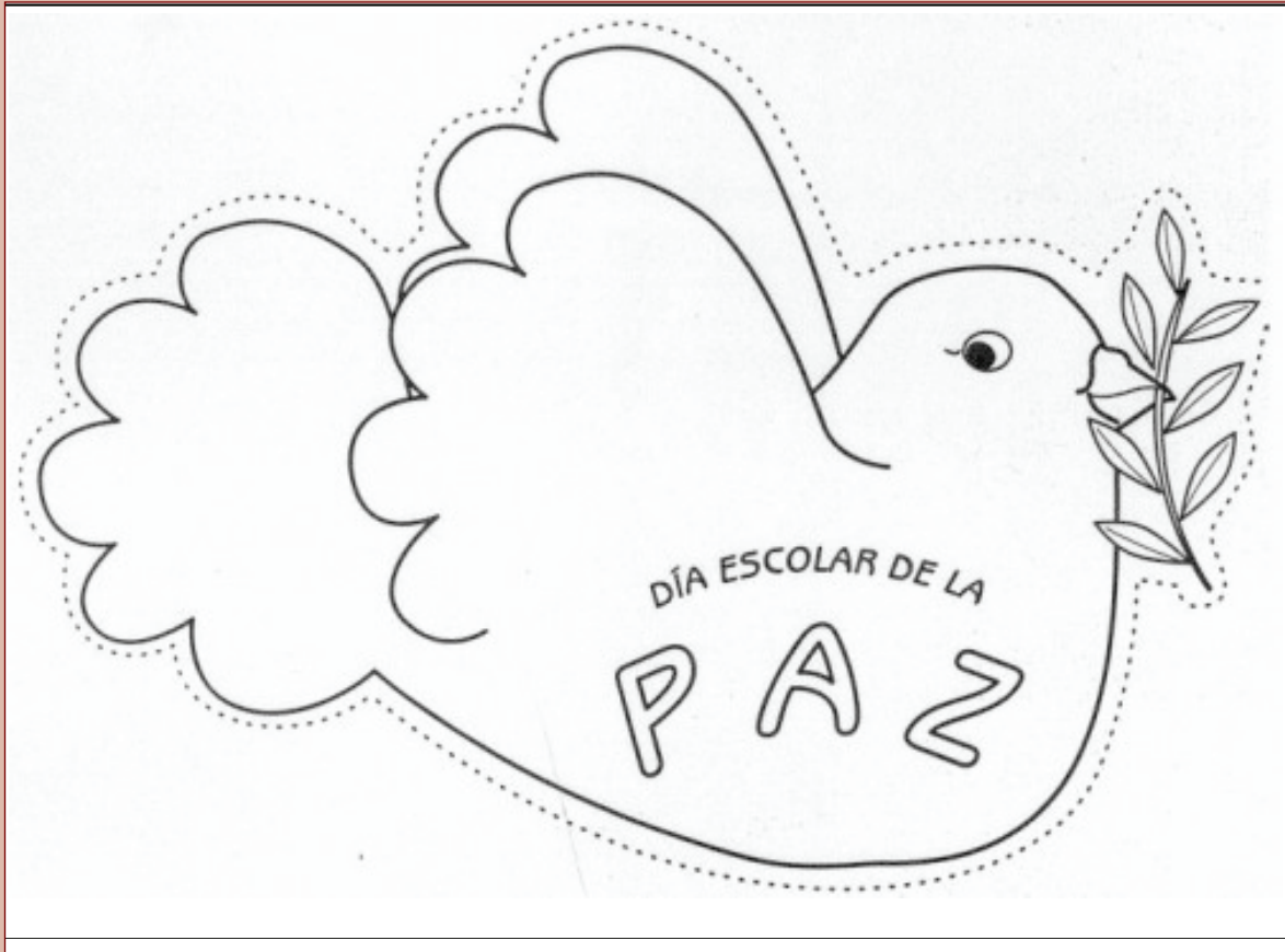
Paloma para utilizar con el alumnado de infantil.